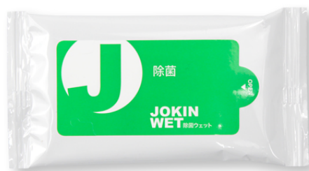
エタノール配合除菌シート

<サイズ>約 W135×H72×D10mm <単位>200 セット～ <名入れ>無