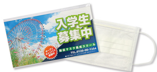
ラベル付エチケットマスク